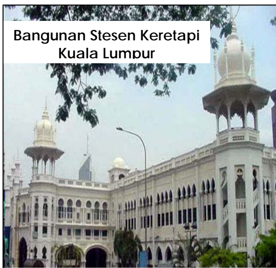
Mengekalkan nilai seni dan estetika