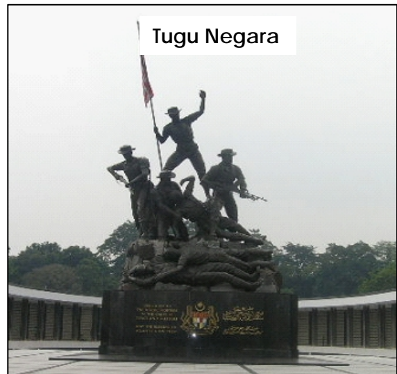
Memupuk semangat patriotik