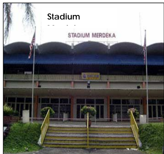
Mengenang sejarah negara