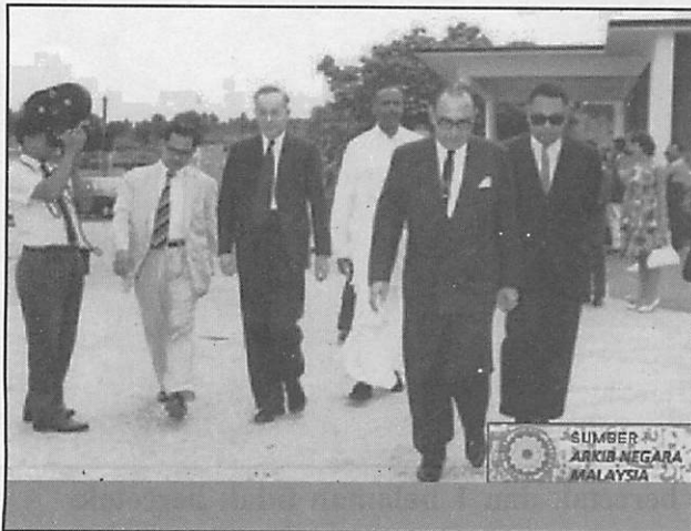
Menghargai Jasa Pemimpin