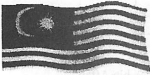
Bendera (Jalur Gemilang)

3. Gambar di bawah menunjukkan lambang-lambang negara kita.